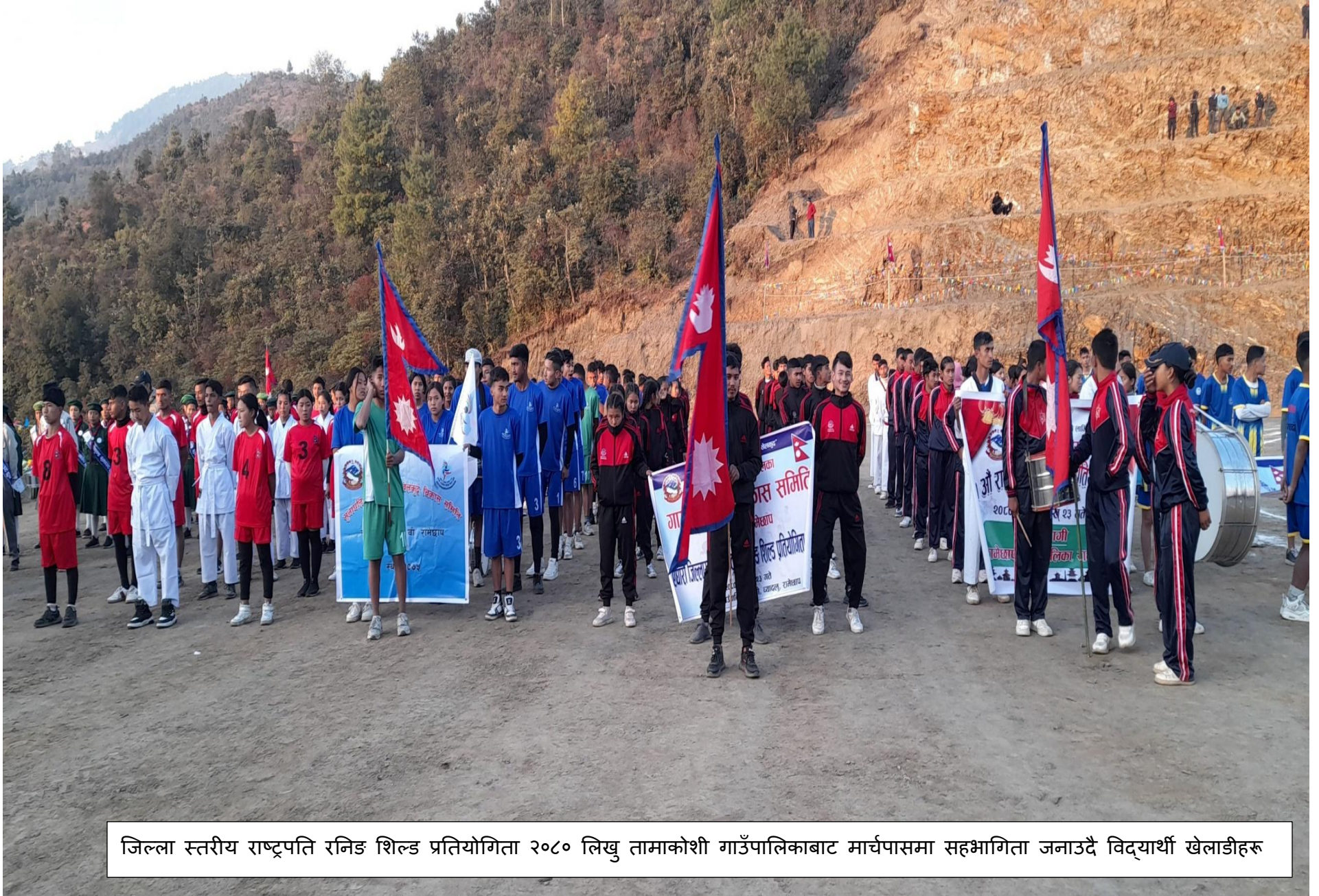
जिल्ला स्तरीय राष्ट्रपति रनिङ शिल्ड प्रतियोगिता २०८० लिखु तामाकोशी गाउँपालिकाबाट मार्चपासमा सहभागिता जनाउदै विद्यार्थी खेलाडीहरू