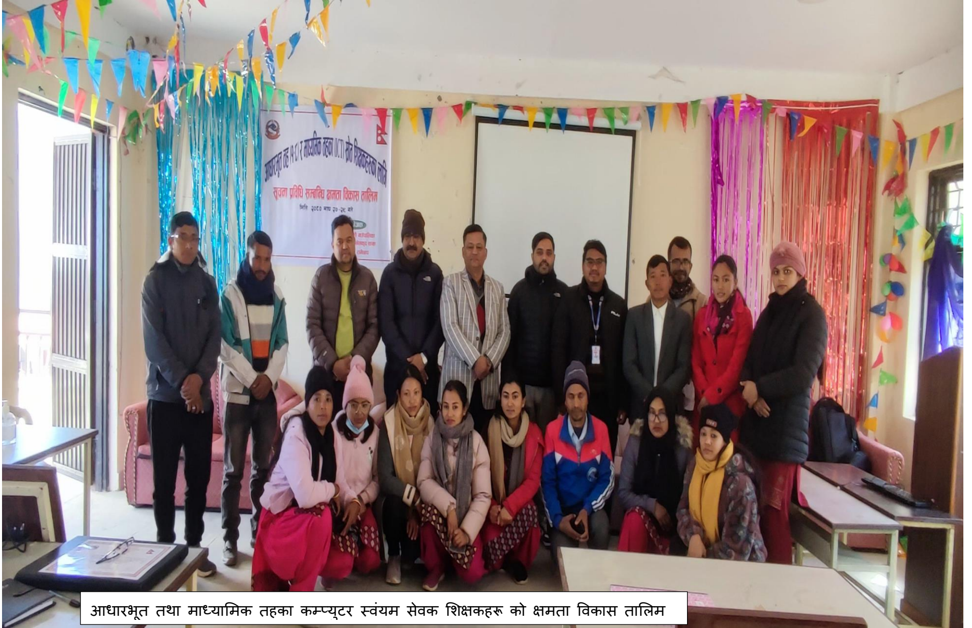
आधारभूत तथा माध्यमिक तहका कम्प्युटर स्वयंम सेवक शिक्षकहरू को क्षमता विकास तालिम