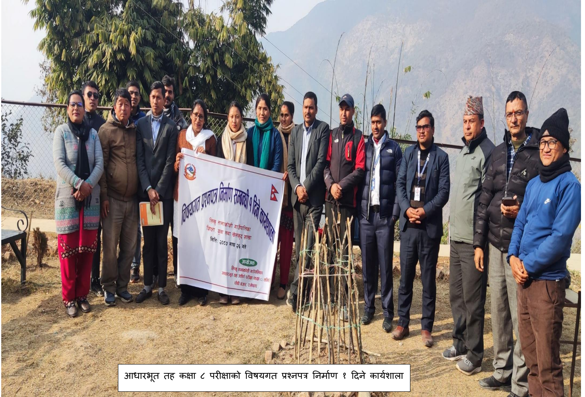
आधारभूत तह कक्षा ८ परीक्षाको विषयगत प्रश्नपत्र निर्माण १ दिने कार्यशाला