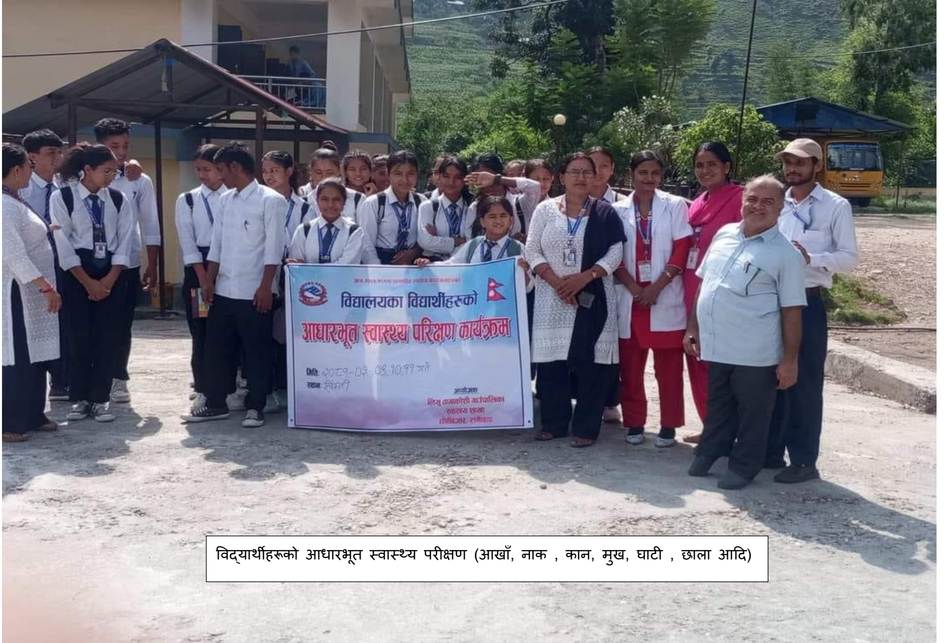
विद्यार्थीहरूको आधारभूत स्वास्थ्य परीक्षण (आखाँ, नाक , कान, मुख, घाटी , छाला आदि)