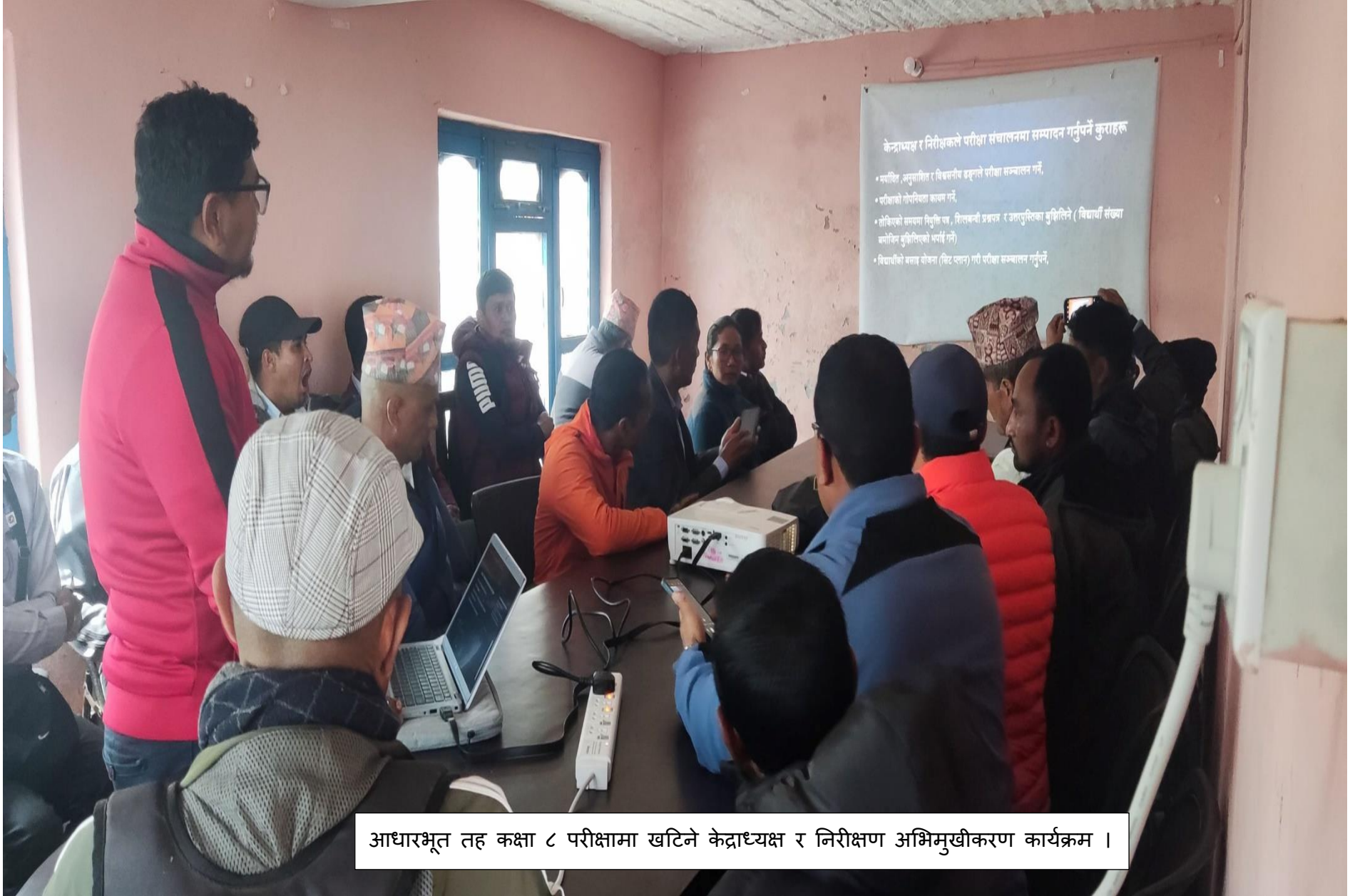
आधारभूत तह कक्षा ८ परीक्षामा खटिने केन्द्राध्यक्ष र निरीक्षण अभिमुखीकरण कार्यक्रम ।