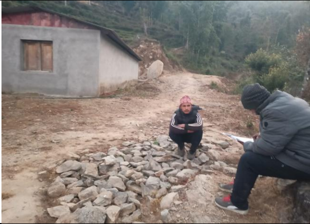
वडा नं १ मा संचालन गरिएको साउनेपानी बालविकास केन्द्र भवन निर्माण तथा व्यवस्थापन योजनाले सामाजिक रुपमा पारेको प्रभावको विषयमा छलफल गर्दै ।