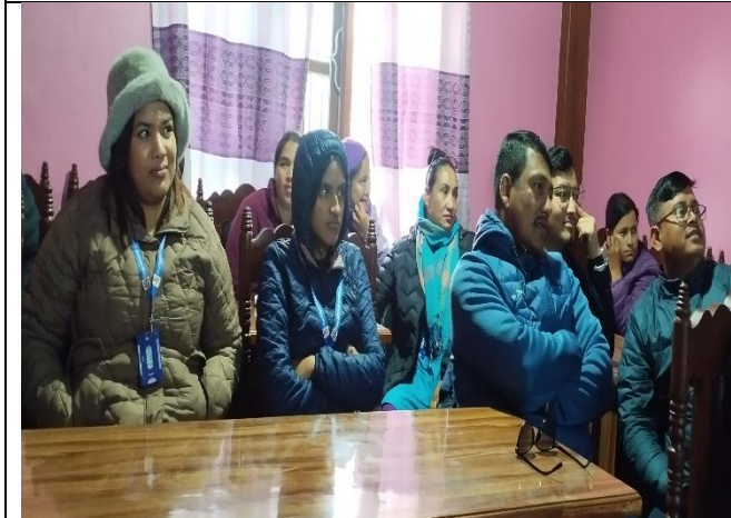
सामाजिक परीक्षणको विधि र प्रक्रिया सम्बन्धी सरोकारवालासँगको छलफल ।