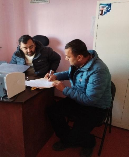
कृषि विकास शाखासँग सम्बन्धीत विषयमा शाखा प्रमुखसँग सूचना संकलन गर्दै ।