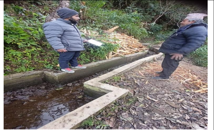
वडा नं २ मा संचालन गरिएका चोक्टेखोला सानाभीर मुहान हुँदै सेता पहरा सिंचाई पहरा योजनाले सामाजिक रुपमा पारेको प्रभावको विषयमा छलफल गर्दै ।