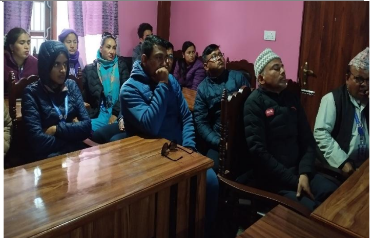
सामाजिक परीक्षणको विधि र प्रक्रिया सम्बन्धी सरोकारवालासँगको छलफल ।