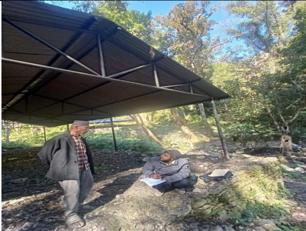
वडा नं ३ मा संचालन गरिएको आइतबारे स्थान ट्रष्ट निर्माण योजनाले सामाजिक रुपमा पारेको प्रभावको विषयमा छलफल गर्दै ।