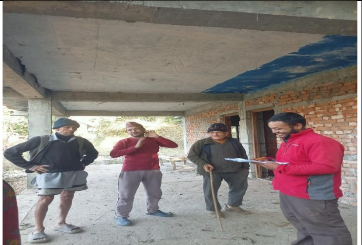
वडा नं ७ मा संचालन गरिएको सुतार कार्की कुलस्थान निर्माण योजनाले सामाजिक रुपमा पारेको प्रभावको विषयमा छलफल गर्दै ।

सार्वजनिक जवाफदेहिता प्रबर्द्धन सम्बन्धी कार्यविधि २०७७ को परिच्छेद-२, अनुसूची-९ (दफा १९ को उपदफा (१) सँग सम्बन्धित)